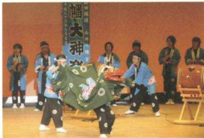
●神嘗奉祝祭の前夜祭での山田大神楽