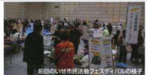
前回のいせ市民活動フェスティバルの様子