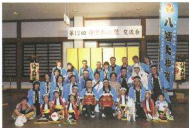
●神嘗奉祝祭に出演した山田町の「八幡大神楽」ご一行