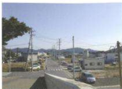
●山田町役場前の現在

遠く隔たった「山田」でつながった二つの街が、その思いの実現のために1年間重ねてきた活動が実現しました。