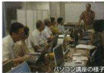
パソコン講座の様子