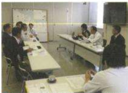
●山田町副町長、危機管理室長と伊勢市役所で危機管理についての研修会