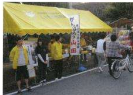
いせまつりでの山田町支援の取り組み(23年度~)

当センターでは昨年3月の東北大地震直後から被災地支援プロジェクトを立ち上げ、とりわけ岩手県山田町への支援を中心に活動を行ってきています。当センターで販売している山田町の醬