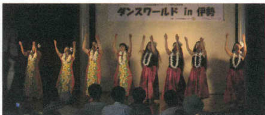
ダンスワールドin 伊勢