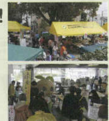
2014年いせ市民活動 フェスティバルの様子