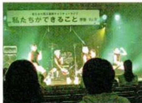
力強いヒップホップダンスを披露する「スタジオDEC→G」のみなさん

募金は38,735円でした。この寄付金は「東日本大震災復興支援」に利用させていただきます。ご協力ありがとうございました。