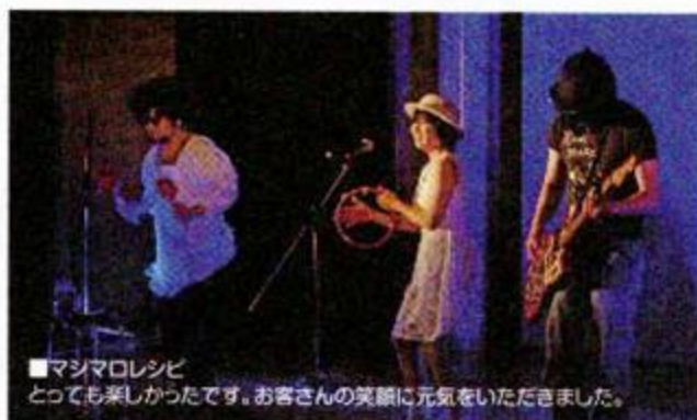
■マシマロレシビ とても楽しかったです。お客さんの笑顔に元気をいただきました。