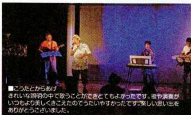
■こうたとかからあげ きれいな照明の中で歌うことができとてもよかったです。歌や演奏がいつもより美しく聞こえたのでうたいやすかったです。楽しい思い出をありがとうございました。