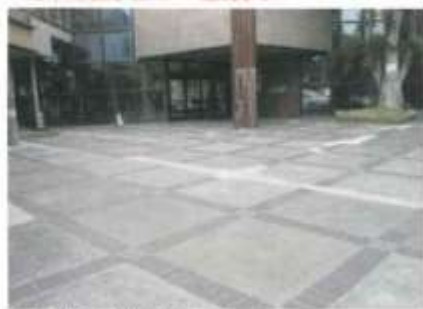
駐車場の整備が終わりました。凹凸がきれいになりました。