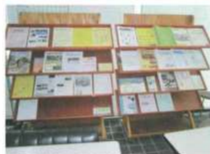
伊勢市社会福祉協議会様から登録団体用の閲覧欄をいただき情報が見やすくなりました。