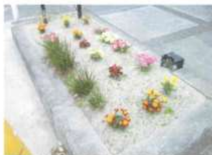
花壇の土づくりから頑張りと、花の苗を植えました。今では見事に花を咲かせています。