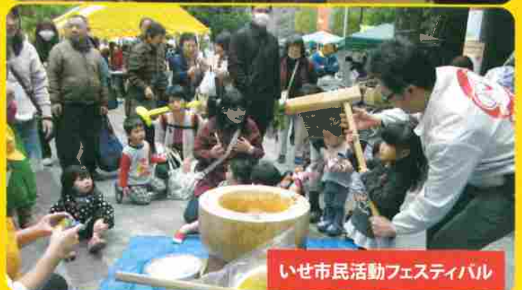
いせ市民活動フェスティバル