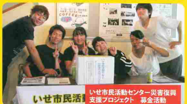
いせ市民活動センター災害復興支援プロジェクト 募金活動