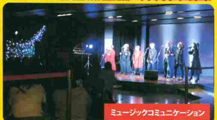
ミュージックコミュニケーション