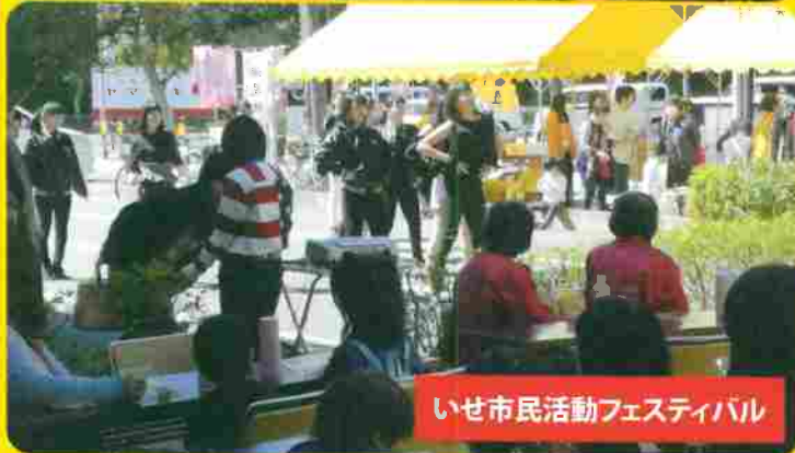
いせ市民活動フェスティバル