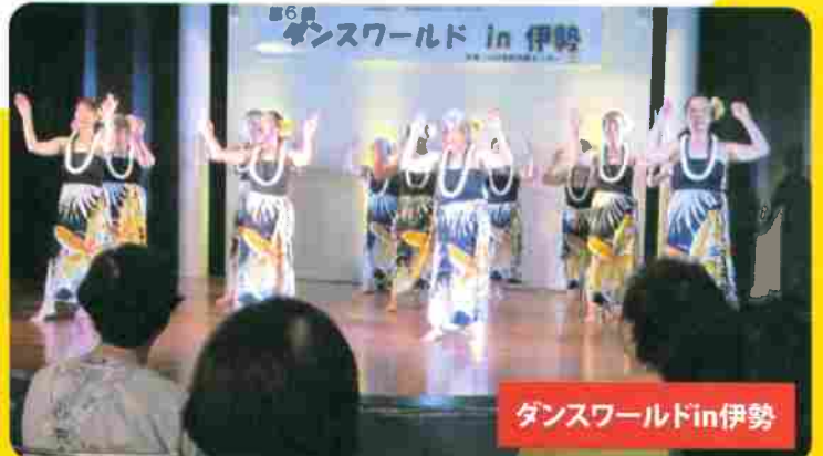
ダンスワールドin伊勢