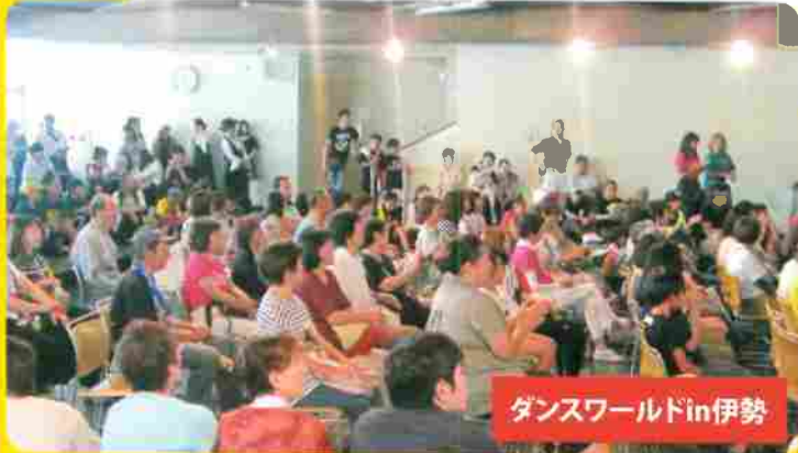
ダンスワールドin伊勢