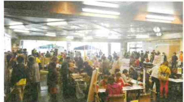
※写真は2019年のフェスティバル